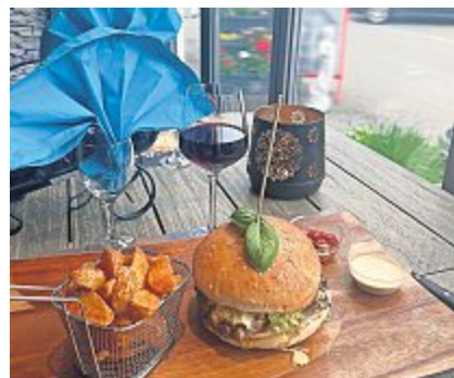
Hausgemachte Burger und feine Saucen sind Spezialität in der Legende-Bar.

Die Wände schmücken Bilder von Film- und Musiklegenden wie Marilyn Monroe oder Elvis Presley. «Bald sollen hier auch Fotos von unseren Stammgästen hängen, denn sie sind