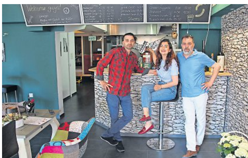
Das Legende-Team freut sich auf die Gäste. an

Zum Angebot gehört unter anderem ein preisgünstiger «Zmorge»: Bereits ab 8.00 Uhr kann man hier täglich Café und Gipfeli für nur 4.20 Franken geniessen, Spiegelei und Speck gibt es für nur 5 Franken. Um aber den richtigen Hunger zu stillen, werden in der neuen Bistro-Lounge auch hausgemachte «Legende»-Burgers oder Chicken Nuggets, Pommes Frites, Bratwurst und andere Street Food - Leckereien angeboten. Dafür zuständig ist in der Küche Fuat Tetik. Im Service wird das Team von Eylül Yildiz unterstützt und im Marketing von Superi Yildiz.