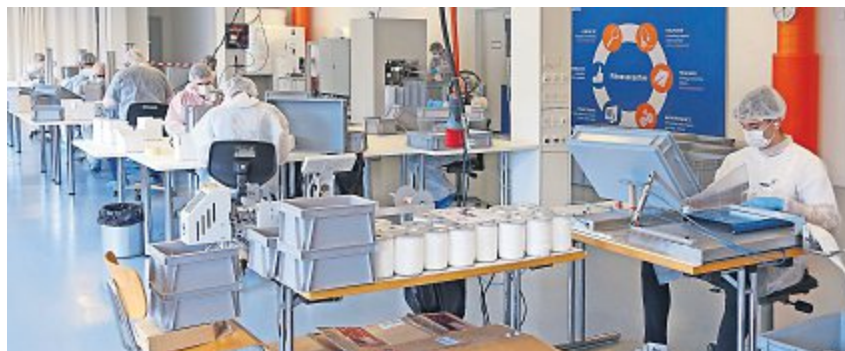
Produktionslinie bei Spühl GmbH in Wittenbach.

Die Produktionsmenge beträgt im ersten Schritt rund 20 000 Hygienemasken pro Tag. Auf der Produktionslinie wird mit Hochdruck gearbeitet, um der starken Nachfrage nachzukommen. Ein Ausbau der Kapazitäten ist bereits in Planung und die Zusammenarbeit mit externen Partnern wird geprüft. Der Verkauf an Grossabnehmer wie kantonale Organisationen, Gemeinden, Pfl-